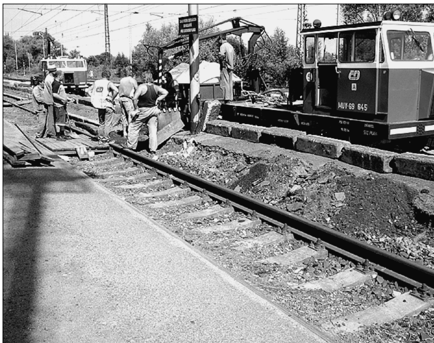
Firma Chládek-Tintěra provádí rekonstrukci nástupiště nádraží ČD Kostomlaty nad Labem (červen 2005).