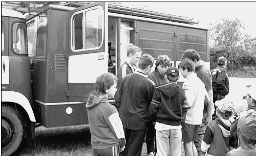
Sbor dobrovolných hasičů v Hroněticích pořádal v sobotu 4. června „Dětský den“. Všem pořadatelům patří velký dík! Na fotografii předávání cen - dostalo se na všechny soutěžící děti.