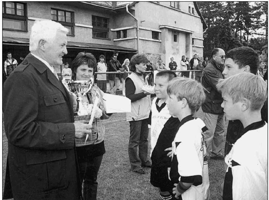
Předávání cen při žákovském turnaji ve fotbale „Memoriál Otakara Zdeňka“.