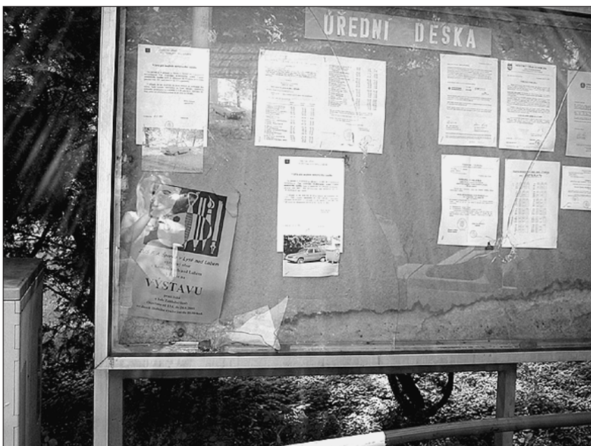
Takto dopadlo sklo úřední desky po útoku vandalů.