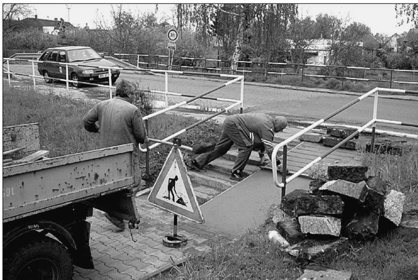
Úprava schodů se setkala s velkým ohlasem. V dohledné době se bude dělat i úprava schodů u přechodu pro chodce před Jednotou tak, aby po nich mohly jezdit maminky s kočárky.