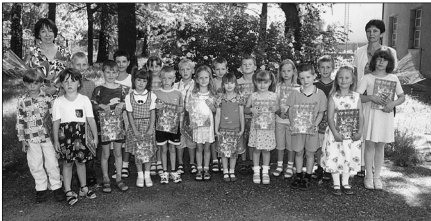
Budoucím prvňáčkům přejeme hodně úspěchů v základní škole!